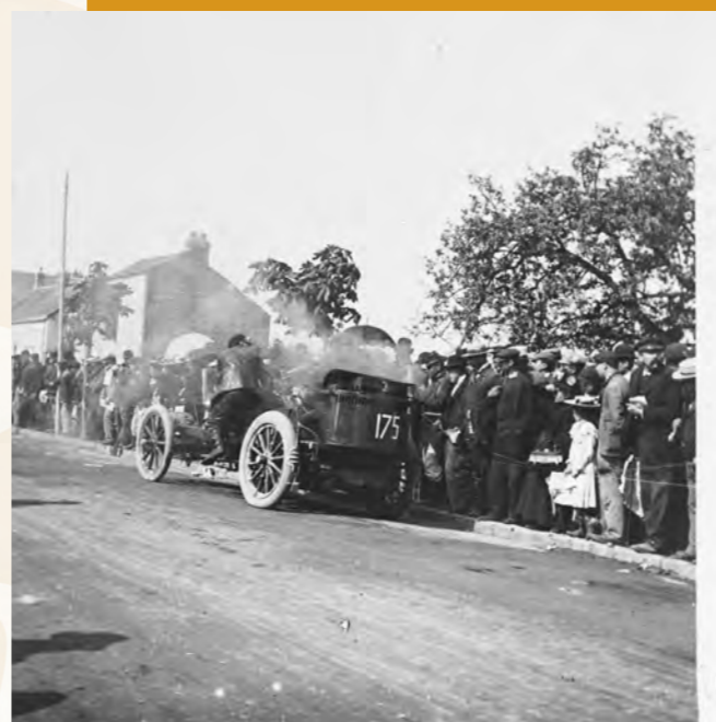
La course automobile Paris-Madrid 1903. - Arch. dép. Eure-et-Loir. 39 Fi 14 A 200 (fonds Nessler)

Le 145 (Caillou, (Seepollot)) venant d'activer ses brûleurs, repart du contrôle de Luisant. 0-208