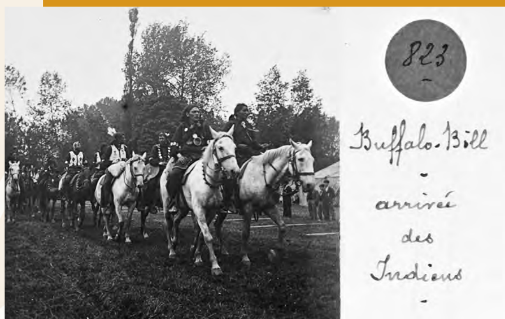
La troupe de Buffalo Bill à Chartres 1905.

L' aviation connaît dans ces années un engouement croissant et l'Eure-et-Loir se démarque dans ce domaine : essais et meetings, parfois mortels, s'enchaînent et voient participer des aviateurs célèbres comme Louis Blériot ou Hubert Latham. Théâtres et cafés-concerts remportent un franc succès, de même que certaines manifestations culturelles et populaires comme le spectacle de Buffalo Bill à Chartres (1905), les foires ou l'arrivée du cinéma dans le département (ouverture du cinéma Palace à Chartres en 1913, par exemple). Ajoutés à l' essor de la mode, de la publicité et de la presse , ces éléments contribuent à faire émerger une première forme de culture de masse et à véhiculer l'image d'une heureuse Belle Époque .