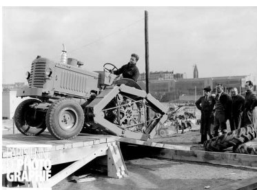
Tracteur Renault Rotapède au Salon de l'agriculture. Paris, 24 février 1954.

Une manifestation organisée avec le soutien de l'Association des amis du Compa et la participation de l'Amicale du Tracteur Renault (ATR).